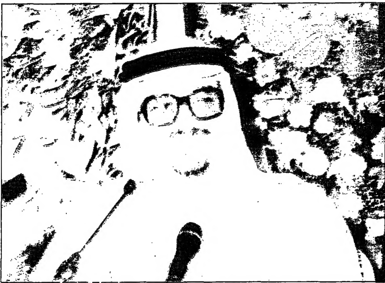
خادم الحرمين الشريفين . قيادة التضامن الاسلامي وصوت الدعوة الحق .

الإسلام هو الأساس.. والمذاهب لا يجب أن تفرق الأمة الاجتهاد مطلوب.. ولكن لا ينبغي أن يخضع اغراضاً بعيدة عن الإسلام هناك من لا يريد أن يتحد المسلمون.. وعلينا أن نواجه أطعما